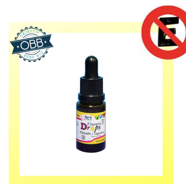
PURE LÉ NATURAL 400, 1000ui