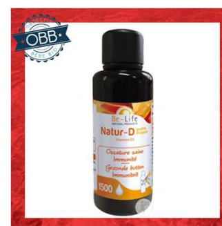
BE LIFE 400ui