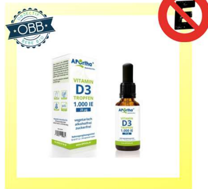
APORHA 1000, 5000ui