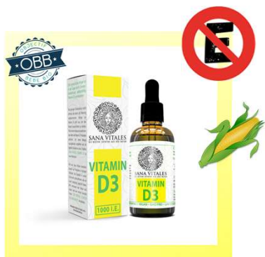
SANA VITALES 1000ui