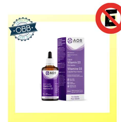
AOR 400, 1000ui