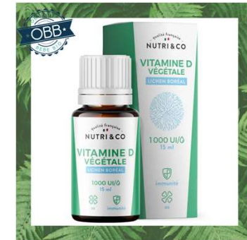
NUTRI & CO 1000ui