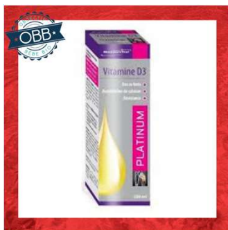
MANA VITAL 250ui