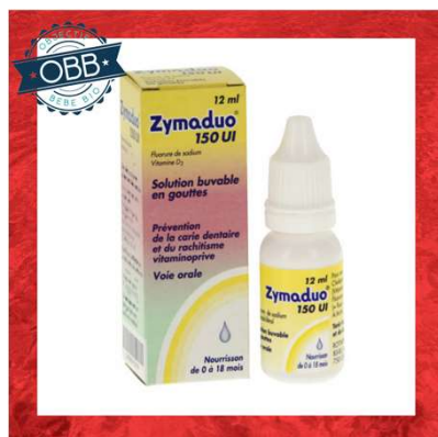
ZYMA DUO 150ui