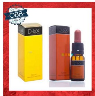
D-IXX 200, 2000ui