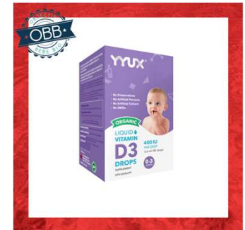
YYUX 400,600, 1000ui