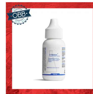
D MULSION 400, 2000ui