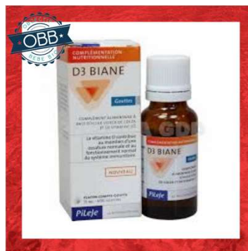
D3 BIANE 200ui