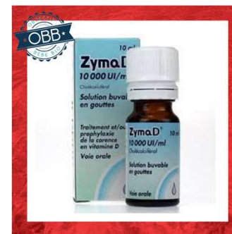
ZYMA D 300ui