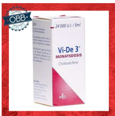
VI-DE D3 100ui