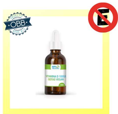
HMS NATURAL 1000ui