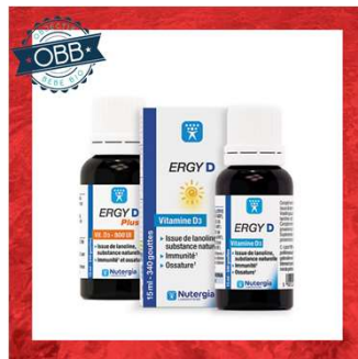
ERGY D & ERGY D+ 200,800ui