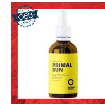
PRIMAL SUN 1000ui