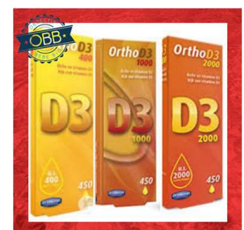
ORTHO D3 1000,2000ui