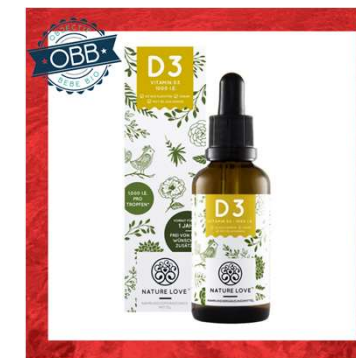
NATURE LOVE 1000, 5000ui