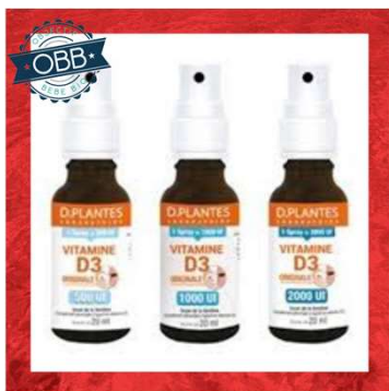
D PLANTES SPRAY 1000, 2000ui