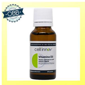
CELL INNOV 200ui