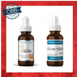
PHYSIOMANCE 400, 1000, 2000ui