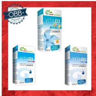
VITA D3 400, 800, 1000ui