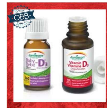
JAMIESON 400, 1000ui