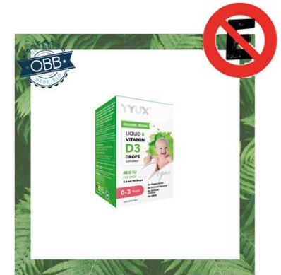
YYUX 400, 600ui