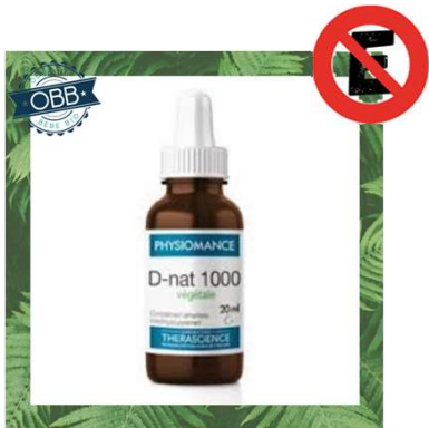
PHYSIOMANCE D-nat 500, 1000ui