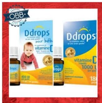
DDROPS 400, 1000ui