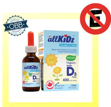
ALL KIDZ 400ui