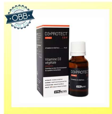
3D PROTECT 200ui