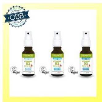
D PLANTE SPRAY 1000, 2000ui