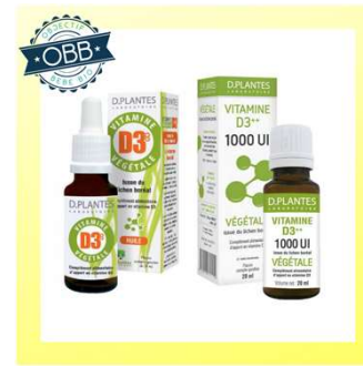
D PLANTE GOUTTE 1000, 2000ui