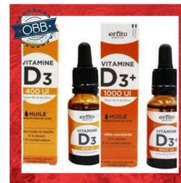
ORFITO 400, 1000ui