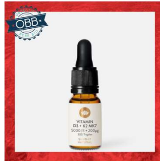
SUNDAY NATURAL 1000, 5000, 10000ui