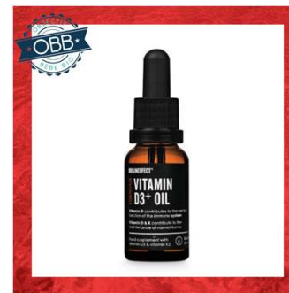
BRAIN EFFECT 1000ui