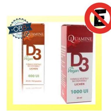
LIQUAMINE VEGAN 400, 1000ui