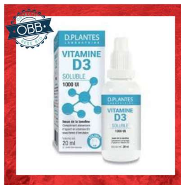
D PLANTE SOLUBLE 1000ui