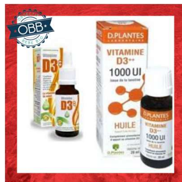
D PLANTES GOUTTE 1000, 2000ui