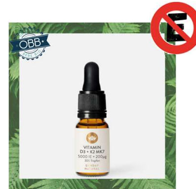
SUNDAY NATURAL 500, 1000, 10000ui