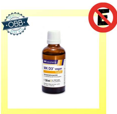
MK NATURPHARMA 1000ui