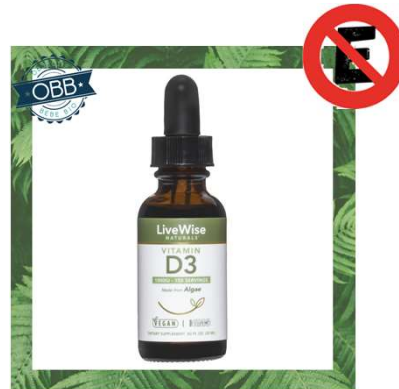
LIVE WISE 200ui