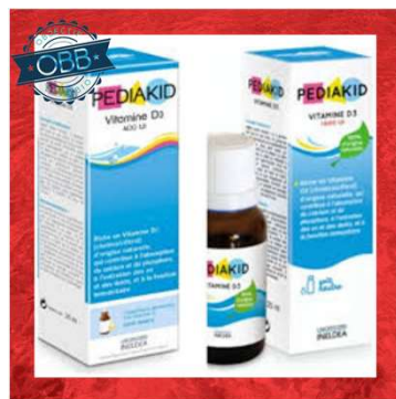
PEDIKID 200, 500ui