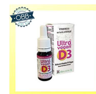
ULTRA VEGAN 200ui