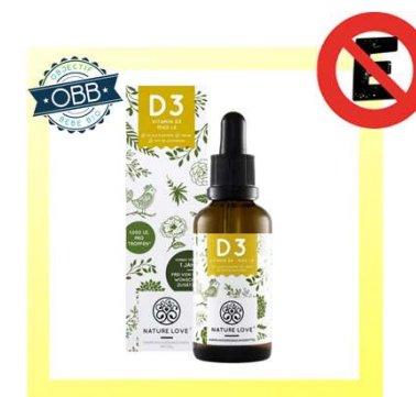
NATURE LOVE VEGAN 1000ui