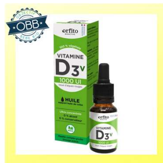
ORFITO VEGAN 1000ui