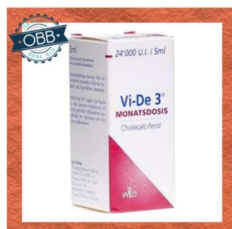
VI-DE D3 100ui