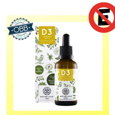
NATURE LOVE 1000, 5000ui