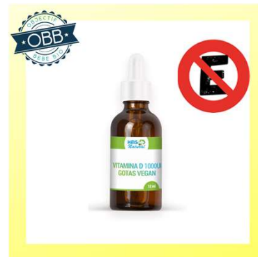
HMS NATURAL 1000ui