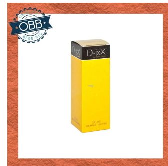
D-IXX 200, 2000ui