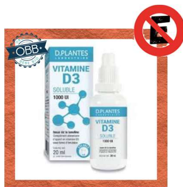
D PLANTE Mulsion 500ui