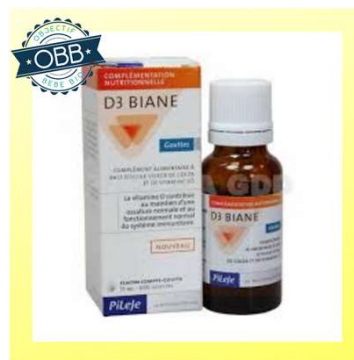
D3 BIANE 200ui