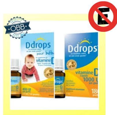
DDROPS 400, 1000ui