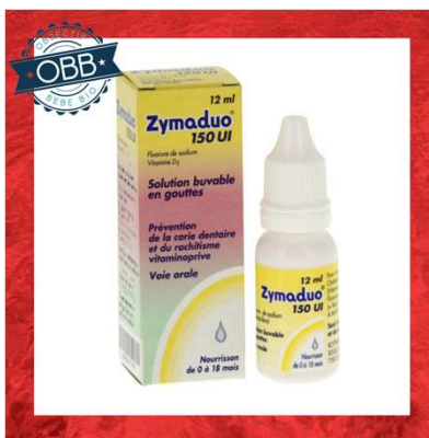
ZYMA DUO 150ui