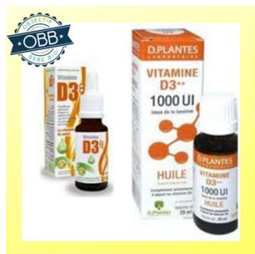
D PLANTES GOUTTE 1000, 2000ui