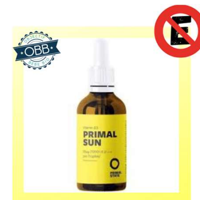
PRIMAL SUN 1000ui