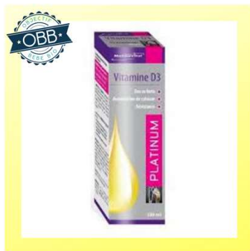
MANA VITAL 250ui