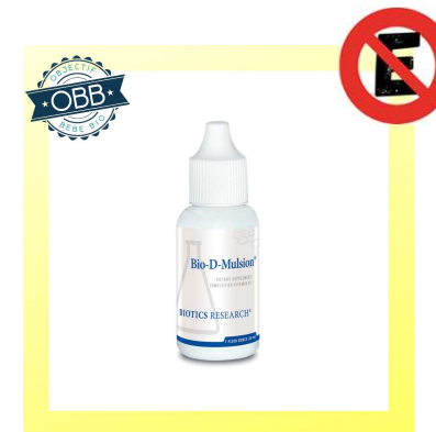
D MULSION 400, 2000ui