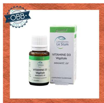
LE STUM 200ui