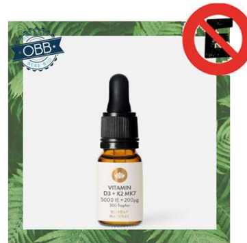
SUNDAY NATURAL 1000, 5000, 10000ui