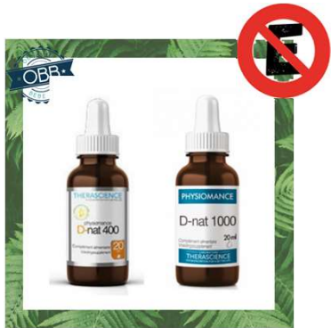
PHYSIOMANCE 400, 1000, 2000ui