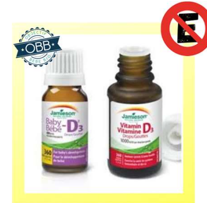
JAMIESON 400, 1000ui