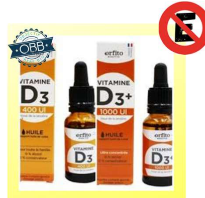
ORFITO 400, 1000ui