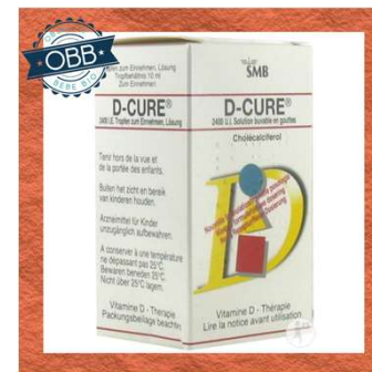
D CURE 100ui