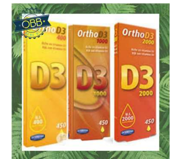
ORTHO D3 1000,2000ui