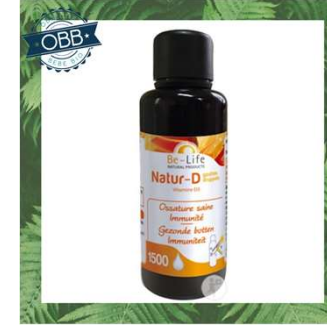
BE LIFE 400ui