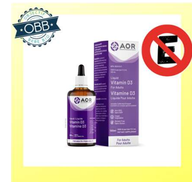
AOR 400, 1000ui