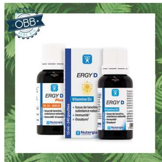
ERGY D & ERGY D+ 200,800ui