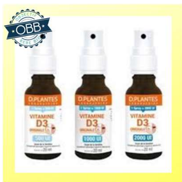
D PLANTES SPRAY 1000, 2000ui