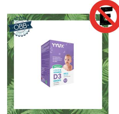
YYUX 400,600, 1000ui