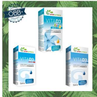
VITA D3 400, 800, 1000ui