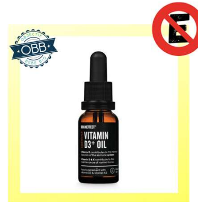
BRAIN EFFECT 1000ui