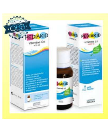
PEDIAKID 200, 500ui