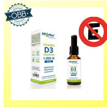
APORThA 1000, 5000ui