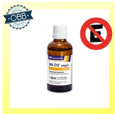
MK NATURPHARMA 1000ui