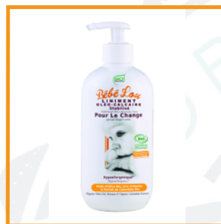
Bébé Lou (22€/L)