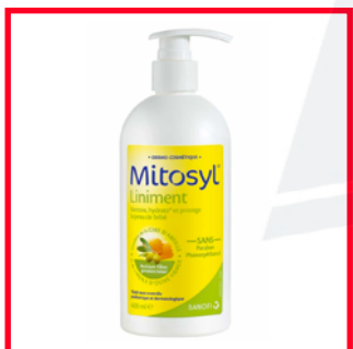
Mytosyl (30€/L) Propylène carbonate (dérivé pétrochimique)