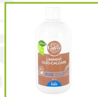
Gifrer Bio (15€/L)