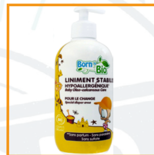
Born to bio (24€/L)