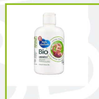
Mots d'enfants Bio (16€/L)