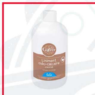
Gifrer (8€/L) PEG