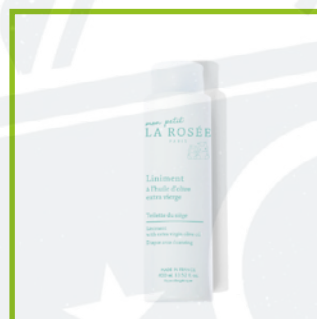
La Rosée (20€/L)