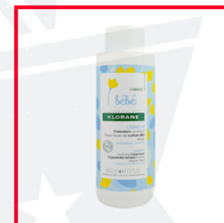
Klorane (11€/L) PEG