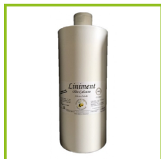
Nature et limousin (15€/L)