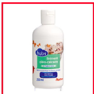
Auchan (14€/L) Paraffine