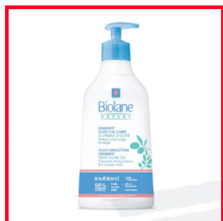
Biolane Expert (11€/L) Propylène carbonate (dérivé pétrochimique)