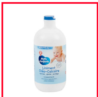
Mots d'enfants (12€/L) Paraffine