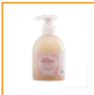
Petite sorcière (40€/L)