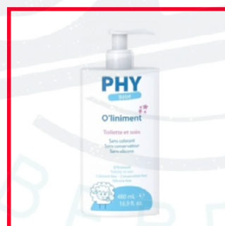
Phy (10€/L) Propylène carbonate (dérivé pétrochimique)