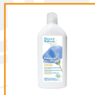
Douce nature (16€/L)