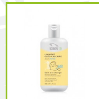
Laboratoire Biarritz (40€/L)