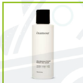
Enamour (125$ ca/L)