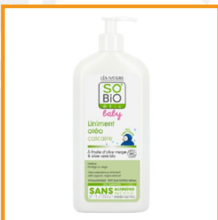
So bio Ethic (20€/L)