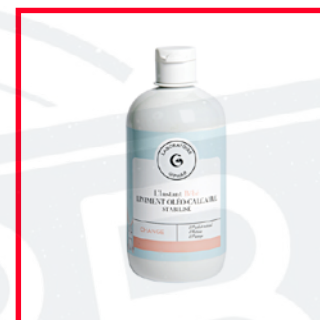
Giphar (12€/L) PEG