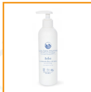
Les ânes d'antan (75€/L)