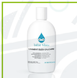
Bébé Hibou (50$ ca/L)