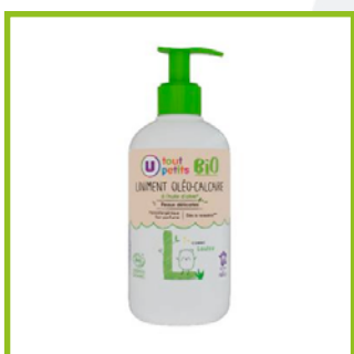
U Bio (14€/L)