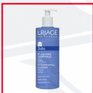
Uriage (10€/L) PEG