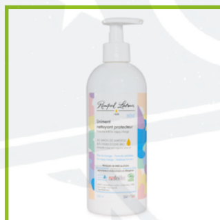
Rampal Latour (29€/L)