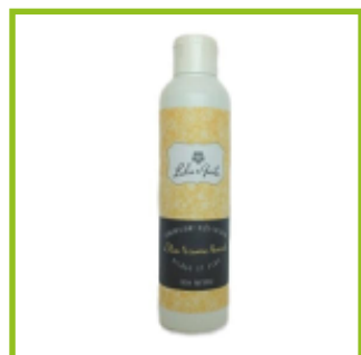
Lulu et guite (70€/L)