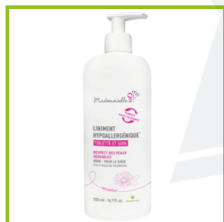
Mademoiselle Bio (20€/L)