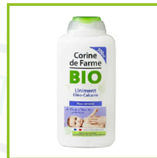
Corinne de Farme Bio (17€/L)