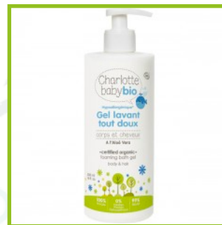
Charlotte Baby bio (22€/L)