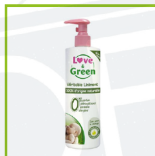
Love and green (20€/L)