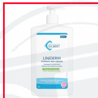
Gilbert (7€/L) Propylène carbonate (dérivé pétrochimique)