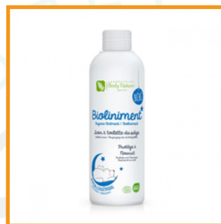
Body nature (30€/L)